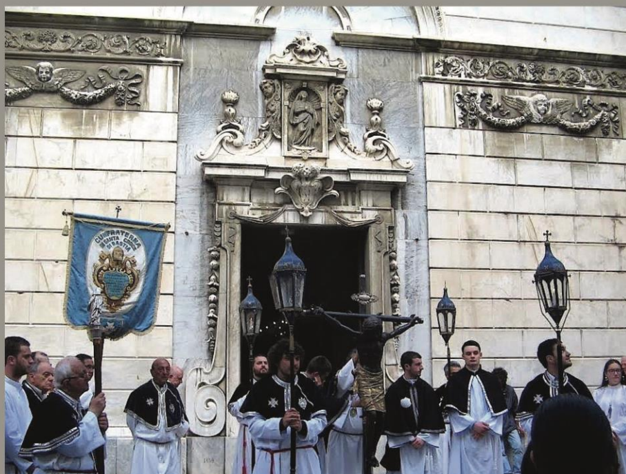
Confraternita di Santa Croce di Bastia

LES CONFRÉRIES, DANS LA SOCIÉTÉ CORSE, DE LEUR ORIGINE À AUJOURD'HUI